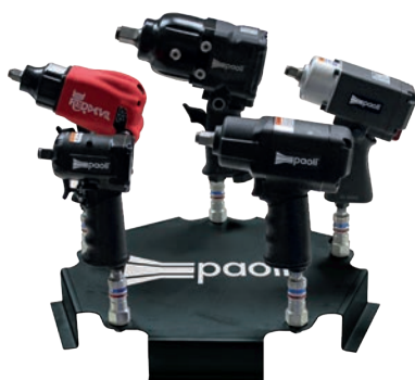
TABLE DISPLAYERS FOR PAOLI IMPACT WRENCHES ESPOSITORI DA TAVOLO PER AVVITATORI PAOLI