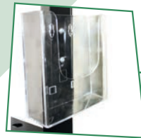
Catalogue holder Portacataloghi

ESPOSITORE SMONTABILE PER PRODOTTI PAOLI