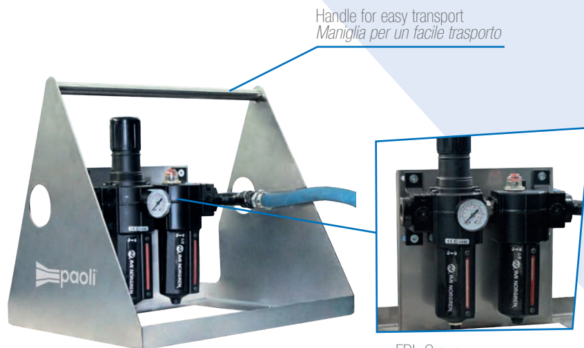
Handle for easy transport Maniglia per un facile trasporto

È provvisto di un gruppo filtro-riduttore di pressione completo di lubrificatore.