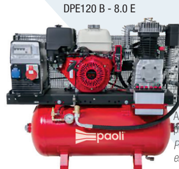
DPE120 B - 8.0 E

Also available: G.04.02.0003 Air production compressor DPE120 D - 8.0 Disponibile anche: compressore per la produzione d'aria