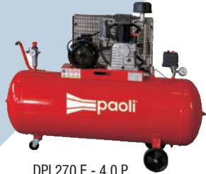
DPL270 E - 4.0 P