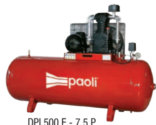
DPL500 E - 7.5 P