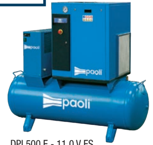
DPL500 E - 11.0 V ES