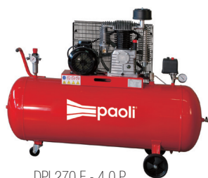
DPL270 E - 4.0 P