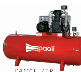
DPL500 E - 7.5 P