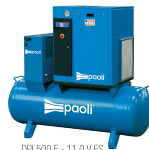
DPL500 E - 11.0 V ES